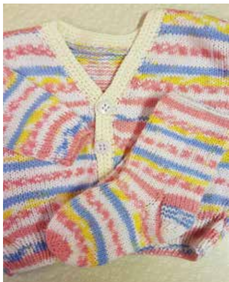
Del av babypaket