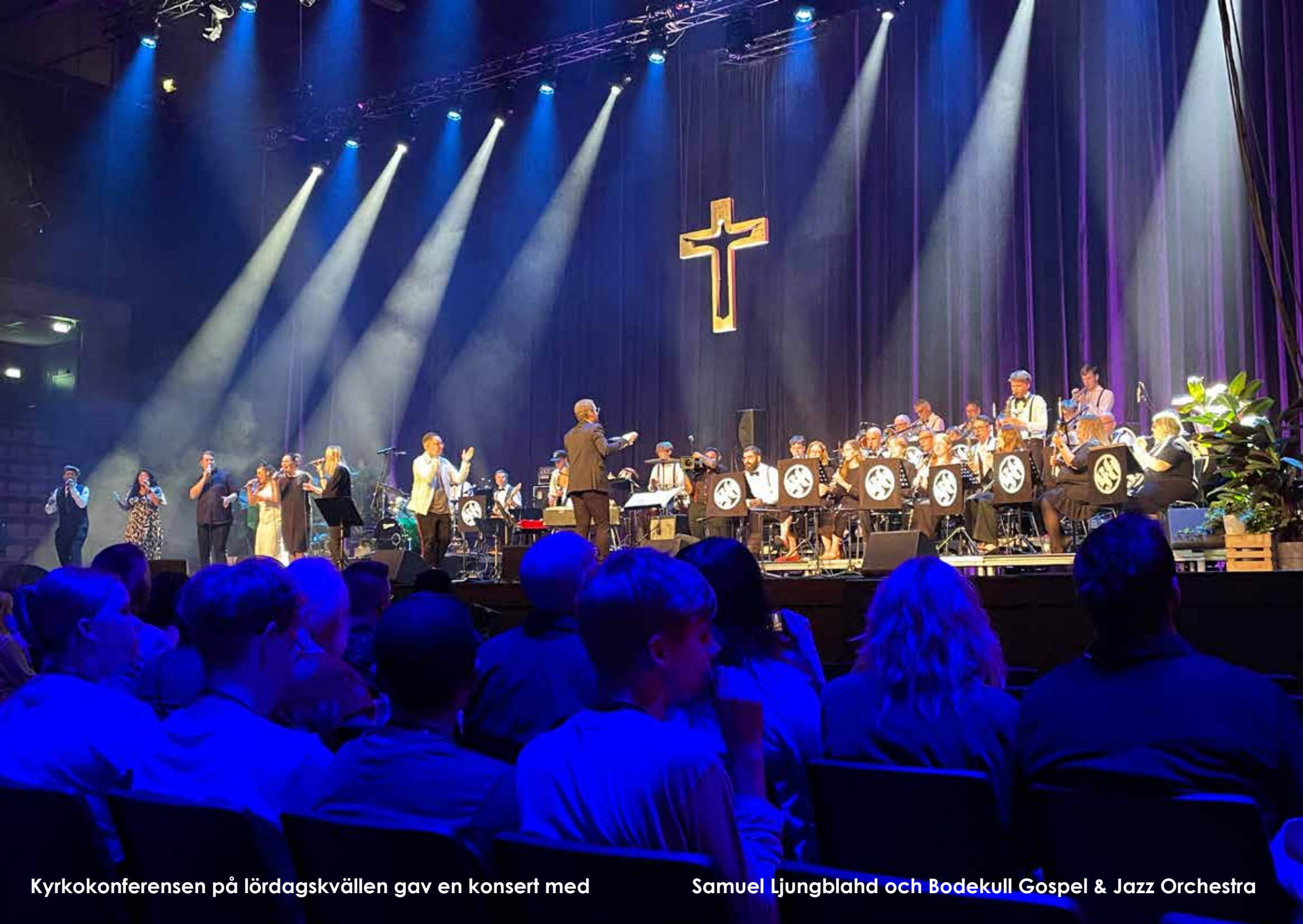
Kyrkokonferensen på lördagskvällen gav en konsert med